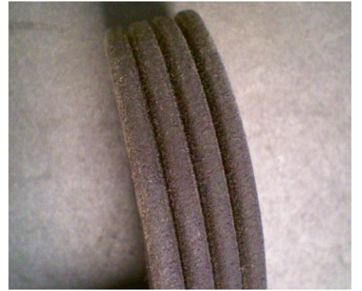
Modifiye edilmiş bir V kayışı için örnek

Optik farklılıklara rağmen yeni modelin performans bakımından dezavantajları yoktur.