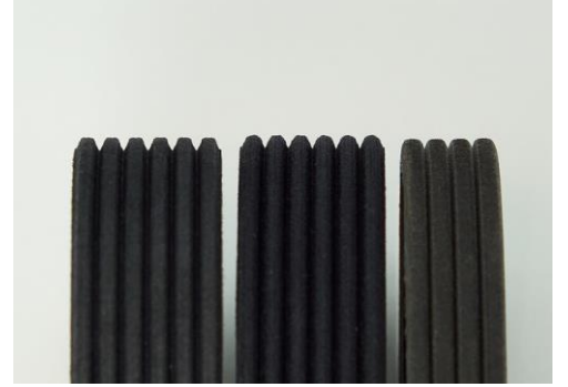
Çıplak gözle çok zor anlaşılır: Modifiye edilmiş profil türleri